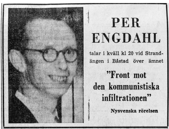
FIGUR 3: Annonser för fascistledaren Per Engdahls framträdande i Båstad ett par veckor efter aktionen.

kampen mot vänsterradikaler. 95 Han fick stöd av Nordvästra Skånes Tidningar , en tidning långt ut på högerkanten som var en av få pressröster i 1960-talets Sverige som försvarade Sydafrikas apartheidpolitik. 96 "Finns inte garantier för att demonstrationer kan försiggå under hyfsade former så finns ingen annan utväg än att skrida till förbud", larmade ledartexten den 4 maj. 97