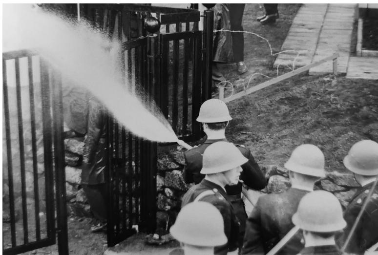
FIGUR 2: Polisen har tagit på kravallhjälm och sprutar vatten på aktivisterna vid norra grinden. Fotografi i volym E2d:8a, Ängelholmspolisens arkiv, Riksarkivet Lund.

förrän de använt sina medhavda attiraljer. Nu plockade de fram ägg, plastpåsar fyllda med svart smörjolja och minst ett paket frysta ärtor. Snart haglade projektilerna över tennisplanen, som träffades av minst tjugo ägg och sex oljepåsar – ärtorna oräknade. 75