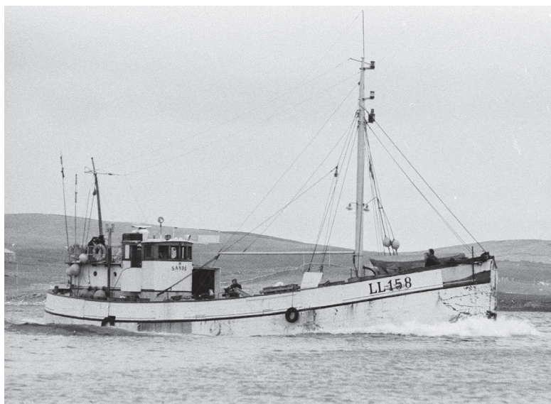
BILD 2. Fiskefartyget LL 158 Sandö, Grundsund, byggd 1948 är i dag en av de sista bevarade svenskbyggda träfiskebåtarna och utgör därmed ett hotat kulturarv. Sandö var den sista bohuslänska fiskebåten som gick på storsjöfiske i Nordatlanten.

I texterna återfinns hänvisningar till aktuell forskning, och författarna knyter an till teoretiska förhållningsätt som rör materialitet, rumslighet och identitet. Antologin borde därför fungera utmärkt för en vidare diskussion om den framtida riktningen för svensk maritimhistorisk forskning och fältets metod- och teoriutveckling. I det följande behandlas de essäer som har ett tydligt materiellt perspektiv.