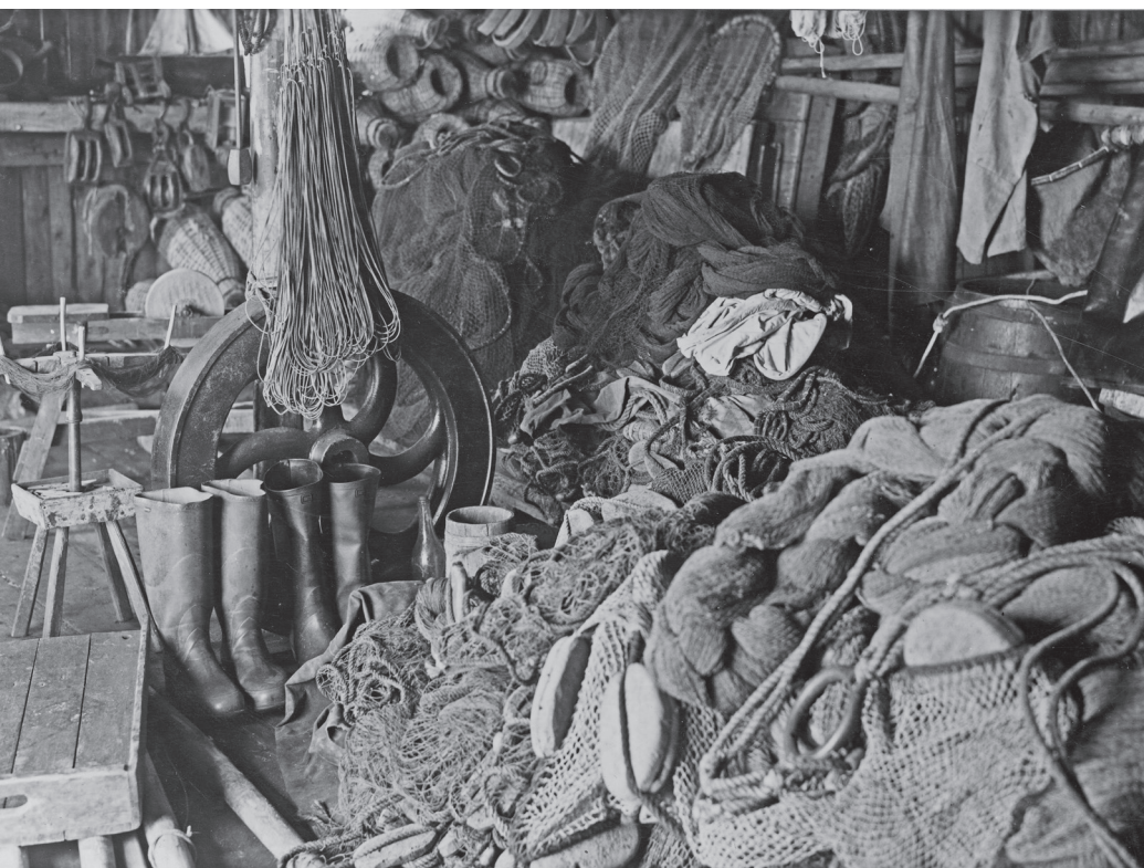
BILD 1. En mångfald av redskap anpassade efter skilda fisken utmärker den äldre Bohuslänska maritima kulturen. Sjöbodsinteriör i fiskeläget Smögen.