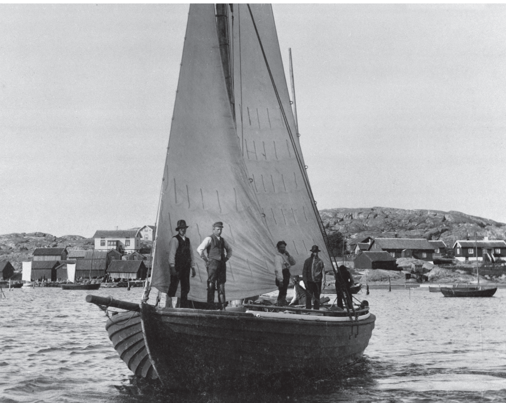
BILD 4. Den nordiska klinkbåtstraditionen fördes upp på UNESCO:s lista över immateriella kulturarv 2021. Tekniken återkommer i mångfalden av allmogebåtar som finns bevarade runt om i Sverige, och kännetecknas av att båtens bord sammanfogas genom att de överlappar varandra.