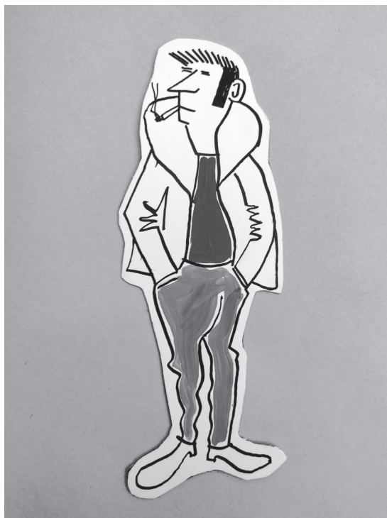
BILD 1. Stilskolan använde flera medietekniker, bland annat flanellograf, för att illustrera god och dålig stil. Här ett exempel på det senare, i form av en man med händerna i byxfickorna och cigarett i mungipan.

formuleringar ersatte moralisk kategorisering av ungdomsproblemen. 14